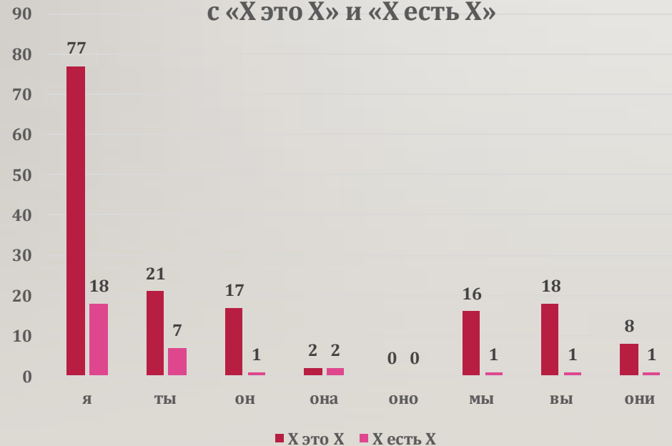
Рис. 1 Распределение примеров с «X это X» и «X есть X»